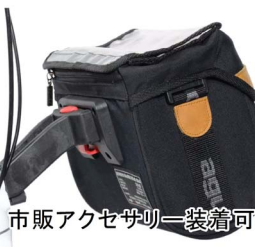
市販アクセサリ装着可