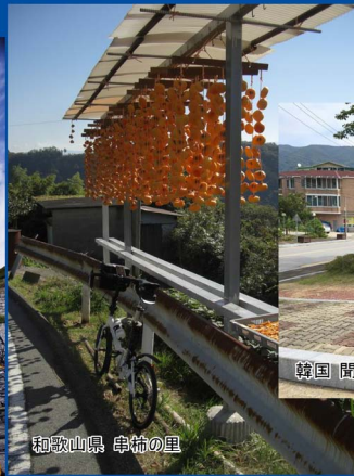
和歌山県 串柿の里