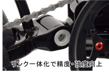
シクラー体化で精度・強度向上