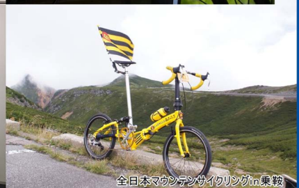
全日本マウンテンサイクリングin乗鞍