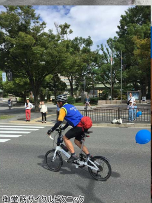
御堂筋サイクルピクニック