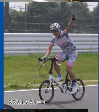
スズカエンテューロ