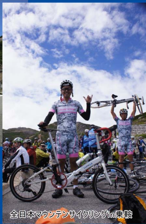
全日本マウンテンサイクリングin乗鞍