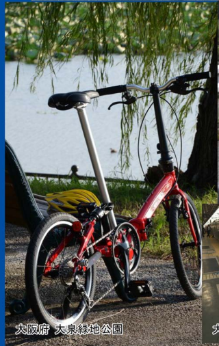
大阪府 大泉緑地公園