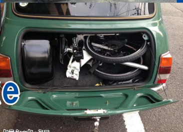
クラシック・ミニ