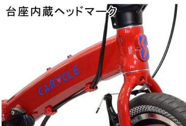
台座内蔵ヘッドマーク