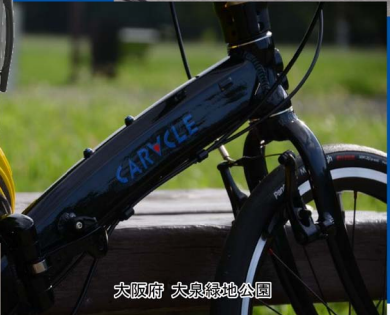
大阪府 大泉緑地公園