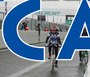
スズカエンテューロ