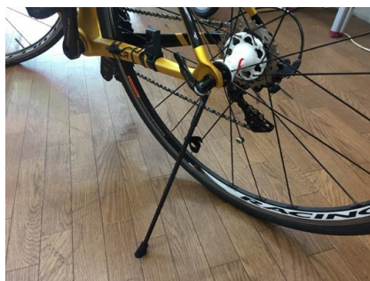
ロードバイクへの装着例 (700)