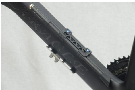
付属クリップでボトル台座に装着可能 (451)