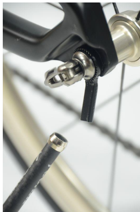
QR に挟んだ台座を本体に挿入