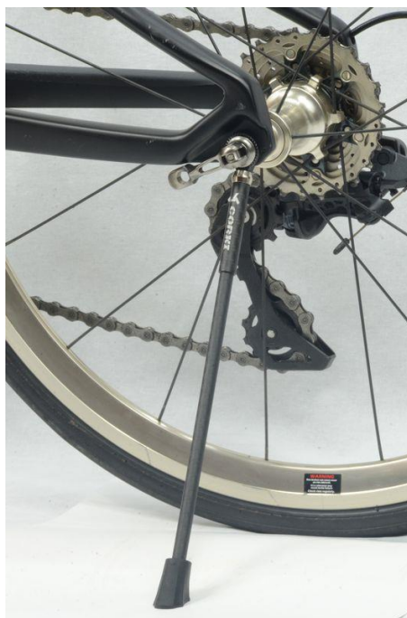
CARACLE-COZ (451) への装着例