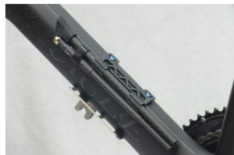
700C 用は二つ折りして装着可能 (700)